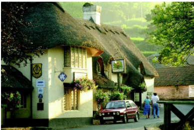
Typisches Inn im Dartmoor Nationalpark