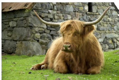
Mittagspause in den Highlands