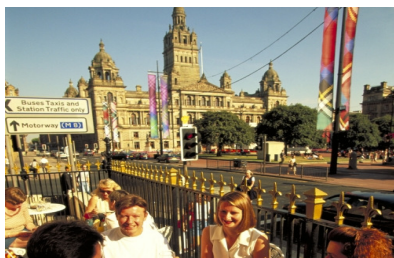
Straßencafe in Glasgow