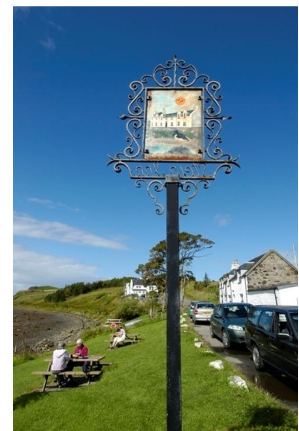
Hier wird Traditionelles serviert