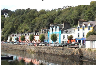
Tobermory, Insel Mull