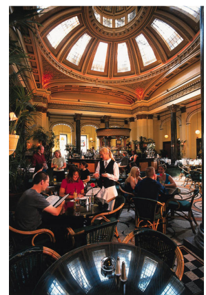
The Dome Pub, Edinburgh