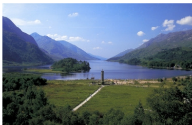
Glenfinnan am Loch Shiel