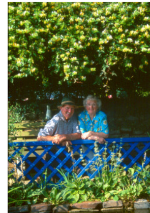
Gärten sorgen für ein Lächeln

Selbstverständlich können Sie diese Reise auch mit Ihrem eigenen Pkw durchführen. Gerne erstellen wir Ihnen ein entsprechendes Angebot inklusive der Fährüberfahrt.