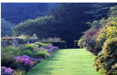
Upton House & Gardens

Individuelle Mietwagen-Rundreise 4 Tage / 3 Nächte