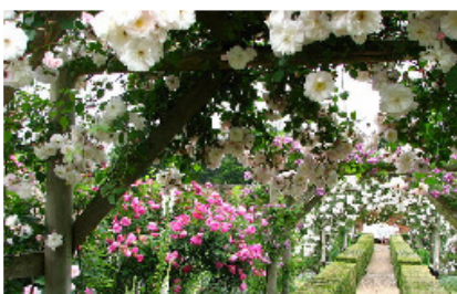
Mottisfont Abbey Garden