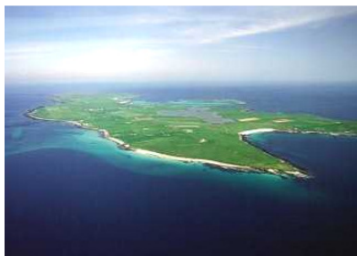
Orkneys von oben