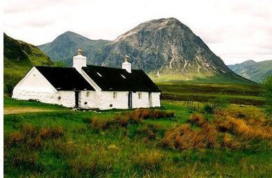
Cottage auf Skye