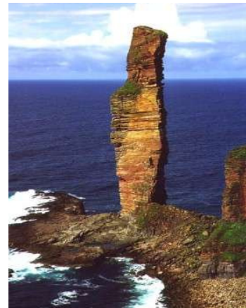
Old Man of Hoy