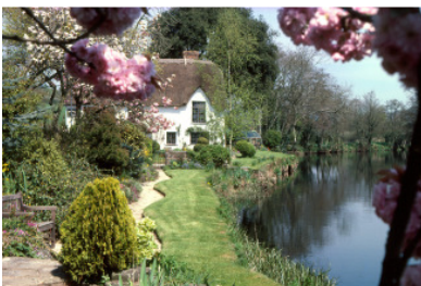
Typisches Cottage in Devon