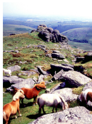
Im Dartmoor Nationalpark

Heute erkunden wir Cornwall , das für seine romantischen Klippenlandschaften, malerischen Dörfer und sein wildes Moorland berühmt ist. Über Bodmin Moor führt die Reise zunächst in die "Künstlerkolonie" St. Ives mit seinen blumengeschmückten Cottages und pittoreskem Charme. Anschließend geht es weiter nach Land's End , Englands südwestlichstem Punkt. Auf der Rückfahrt entlang der Küste bietet sich ein schöner Blick auf St. Michael's Mount . Schließlich führt die Fahrt nach Polperro , ein typisches Hafenstädtchen, und zurück nach Plymouth.