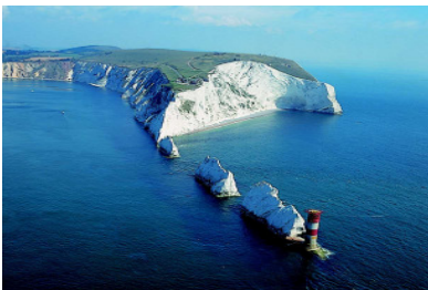
Isle of Wight