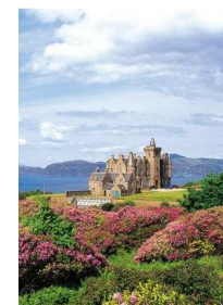
Privat-Castle Insel Mull