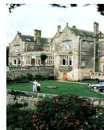
Kildrummy Castle Ht