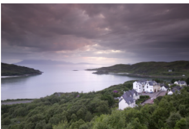
Loch Morar an der Westküste