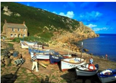
Idyllischer Fischerort im Westen