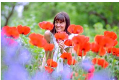
Blütenpracht in Cornwall