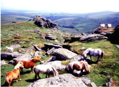
Wilde Ponies im Dartmoor