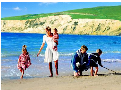
Muschelsuchen am Meer