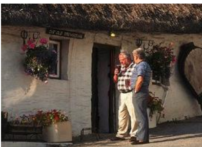
Ein entspannendes Pint