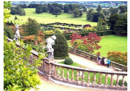
Powis Castle Gardens