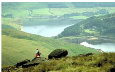
Blick auf Derwentwater, Lake District