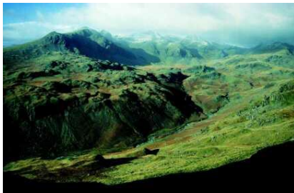
Glencoe – Tal der Tränen