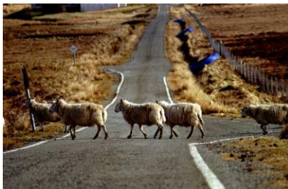
Rush Hour in den Highlands