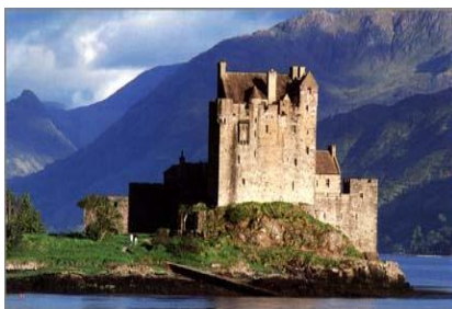
Eilean Donan Castle