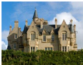
Castle auf Mull

Beispiel B: 2 Nächte Privat-Castle in Zentralschottland B&B p.P. € 204,00