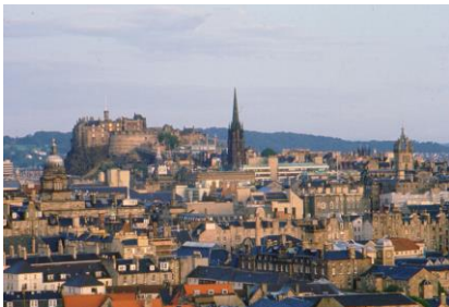
Skyline von Edinburgh

Individuelle Pkw-Rundreise 10 Tage / 9 Nächte