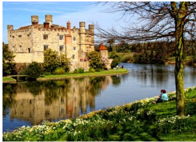
Hampton Court Palace