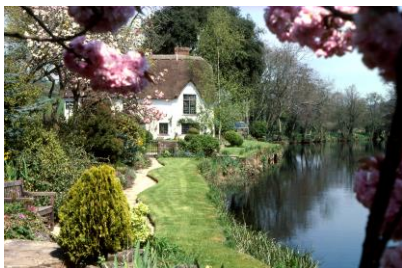
Typisches Cottage in Südwestengland