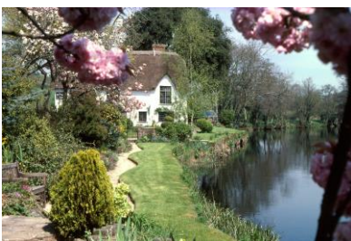
Typisches Cottage in Devon