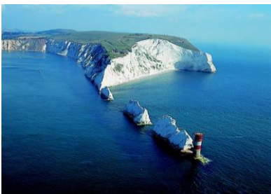
Isle of Wight