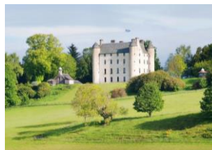
Castle-Feeling pur in Perthshire

Scottish Explorer Pass: Ihr Ticket für freien Eintritt zu über 300 staatlichen, historischen Stätten in ganz Schottland, gültig an 7 Tagen innerhalb von 2 Wochen p.P. € 60,00