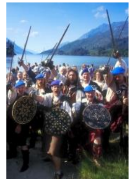
Auf in die Schlacht!