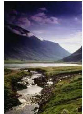
Glen Coe -Tal der Tränen