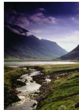
Glen Coe -Tal der Tränen