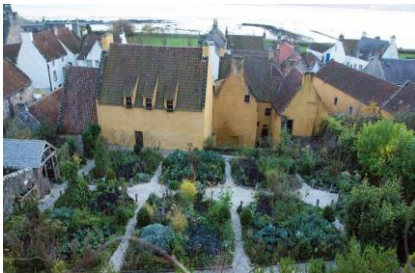
„Cranesmuir“ - pittoresker Drehort