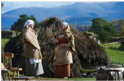
Newtonmore Highland Folk Museum