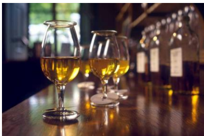
Das schottische Lebenswasser