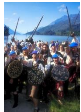
Auf in die Schlacht!