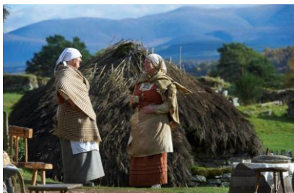
Newtonmore Highland Folk Museum