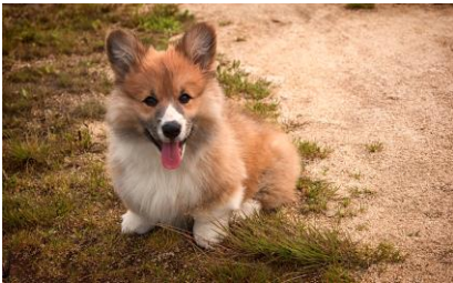
Welsh Corgie im Land seiner Vorfahren