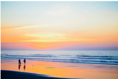
Tolle Spaziergänge am Meer!