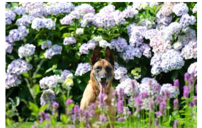
Viel grüne Landschaft zu erkunden!