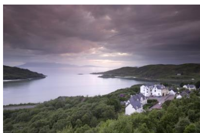
Loch Morar an der Westküste