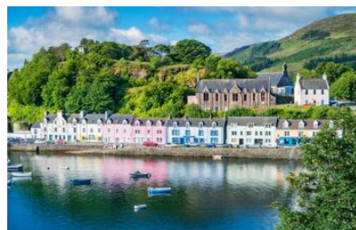
Portree, Isle of Skye