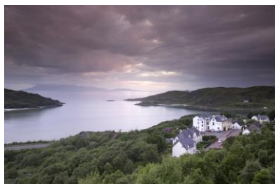
Loch Morar an der Westküste